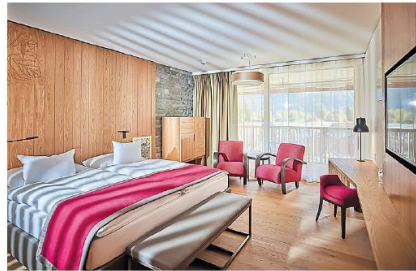
Das Hotel verfügt über 148 komfortable Zimmer und verwöhnt Sie mit individuellen Massagebehandlungen.

W ellness und Komfort im Herzen des Wallis: Das bietet das 4-Sterne-Hotel Les Bains de Saillon, welches sich auf halbem Weg zwischen Martigny und Sion befindet. Ein brandneuer Hoteltrakt schwingt sich in einem leichten Bogen auf einer Länge von 140 Metern um die Thermenlandschaft. Er umfasst 78 Zimmer, sechs Themenrestaurants und den neuen Eingangsbereich für die Therme. Die neuen Zimmer sind mit edlen Materialien ausgestattet: Steine aus einem benachbarten Steinbruch zieren einen Teil der Mauern, die Böden sind mit Holzparkett ausgestattet, und Motive des Weinbaus dominieren die Innendekoration. Mit